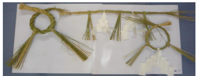
新しい年を迎えるにふさわしい立派なしめ縄が完成しました。