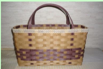
こちらの作品を作ります