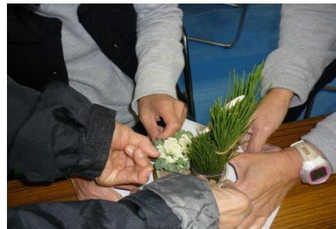
外枠飾りはみんなで協力