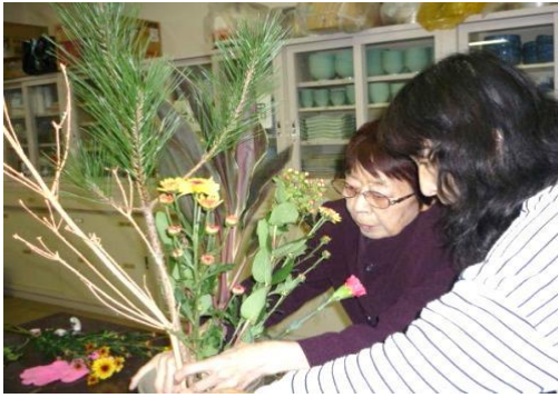
1人1人、丁寧に教えていただきました