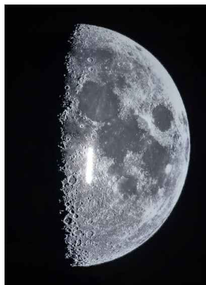
望遠鏡からみた月

ようやく実現した星座観察会。 望遠鏡で月のクレーターを見ると「わー すごい！」と歓声があがるなど38万キロ離れた月の表面が手にとるようにみえました。また、土星の環もはっきりと見え宇宙の神秘をのぞく事ができました。 その他のさまざまな星座も確認しました。